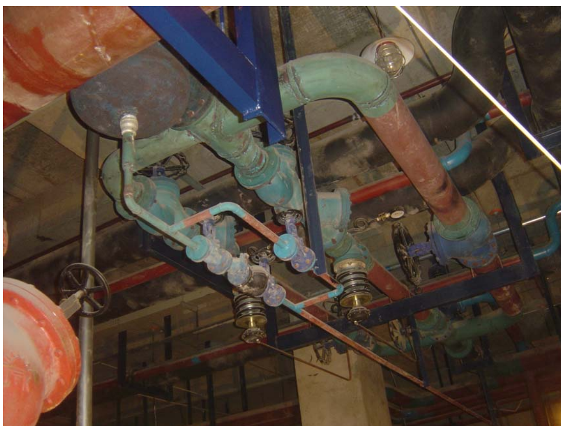
并联式蒸汽减压站