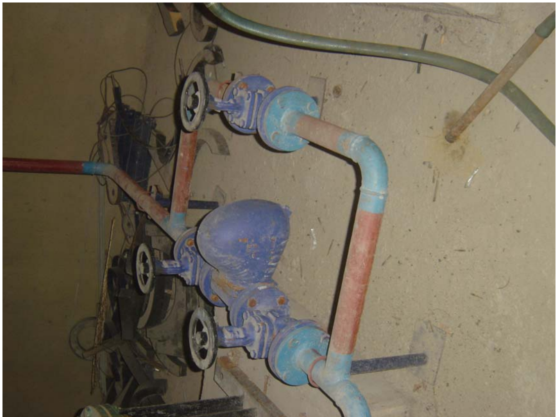
多功能浮球式疏水阀组