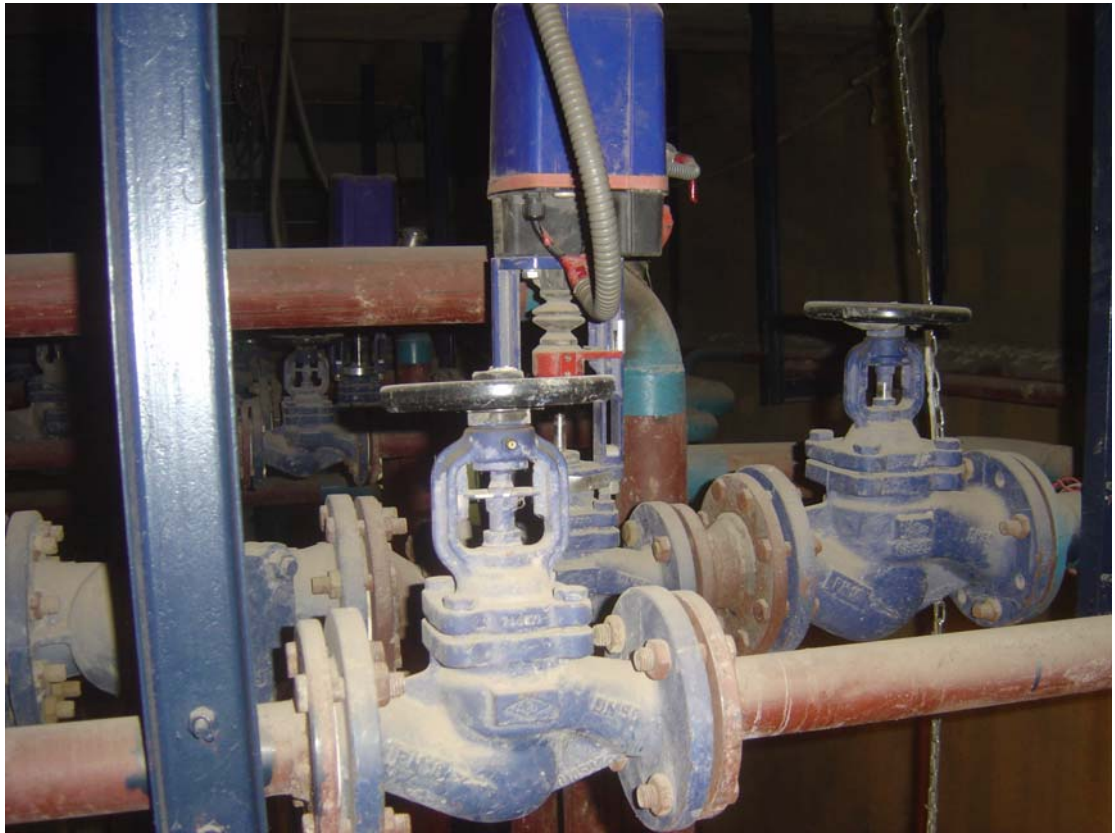
蒸汽温度控制阀组