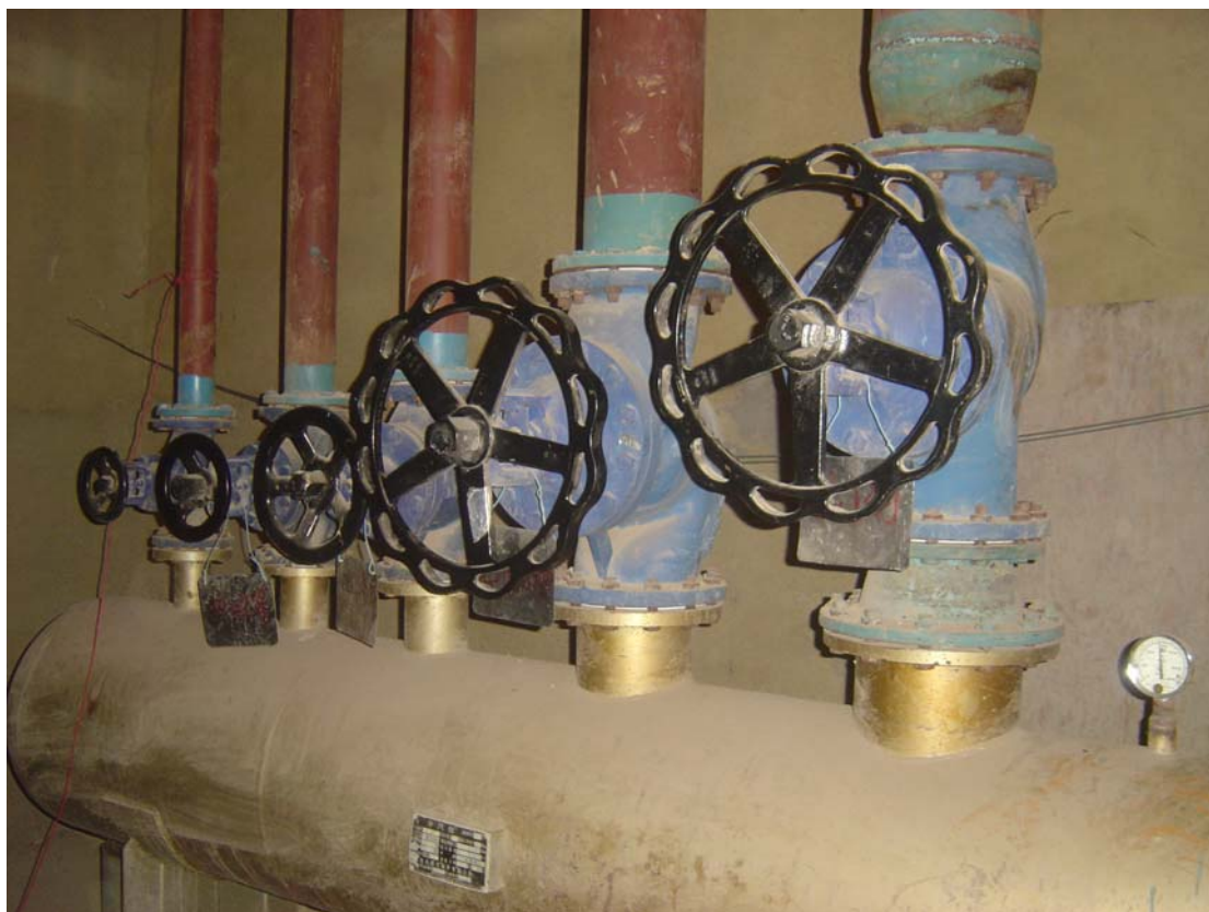
分汽缸双波纹管截止阀