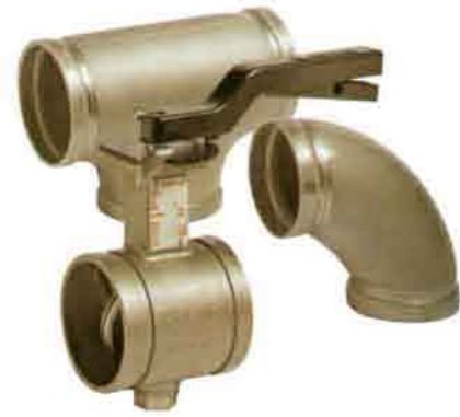
镀锌或不锈钢沟槽气体管路连接系统