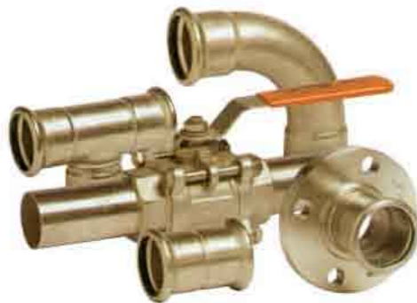
卡压不锈钢气分管路连接系统